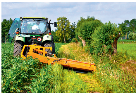
Klepelmaaier onder hoek met zijdelingse afvoer.

enige optie om de strook te beheren is maaien. Dat mag gedurende het hele jaar, maar je doet het bij voorkeur vóór de probleemkruiden in het zaad komen. Gebruik hiervoor een klepelmaaier of schijvenmaaier. Met een trekker op aangepaste wielen met een side-shift-maaier of klepelmaaier op arm kan je ook maaien als de teelt op het veld staat, zoals bij mais en aardappelen. Hou daarbij dan rekening met de zaai- of plantafstanden.