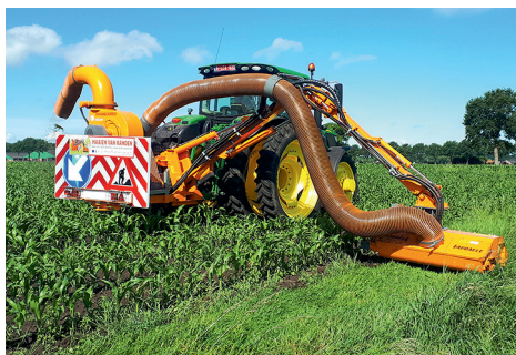
Klepelmaaier op arm met wegblaassysteem.

Teeltvrije strook van minimum 1 meter: geen grondbewerking, geen bemesting en geen gewasbescherming.